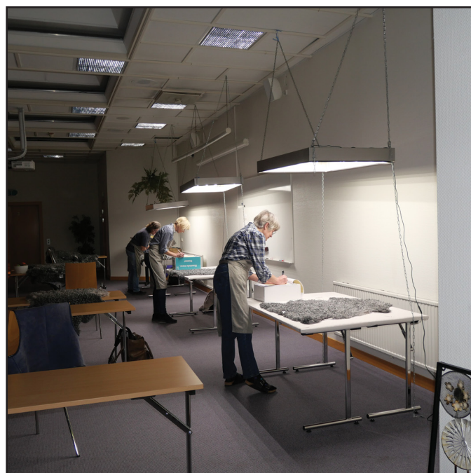
Bedömer varje enskilt skinn.