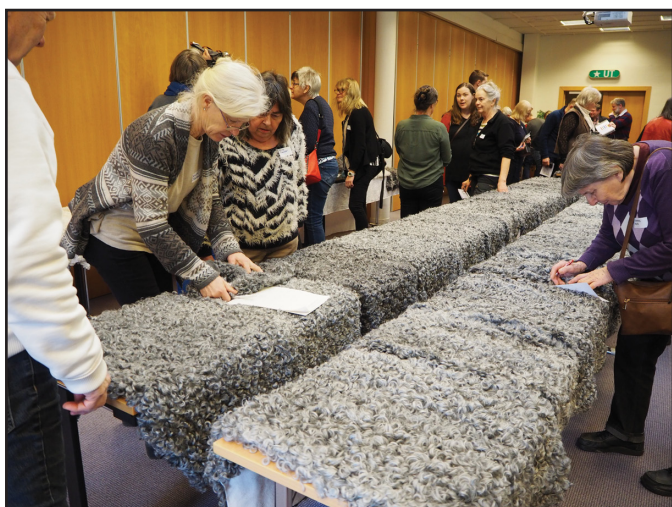
Skinnpremiering med publik.

En hjälp på traven, är att numera på premieringsutställningen, efter prisutdelningen så visas vid skinnen vilken bagge som är far till lammet, något som kan sporra och vägleda i sökandet efter nytt avelsmaterial till kommande säsonger. Det är ett gyllene tillfälle att träffa andra fårägare med samma intresse att byta erfarenheter och knyta kontakter med.